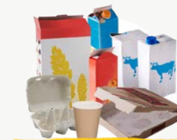
EMBALLAGES CARTONS & BRIQUES ALIMENTAIRES